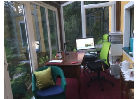
Gottes Geschenk an mich - mit Ihm an einem himmlischen Ort zu sitzen...